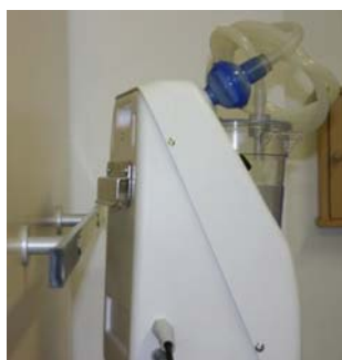
SUPPORTO per posizionamento su barra